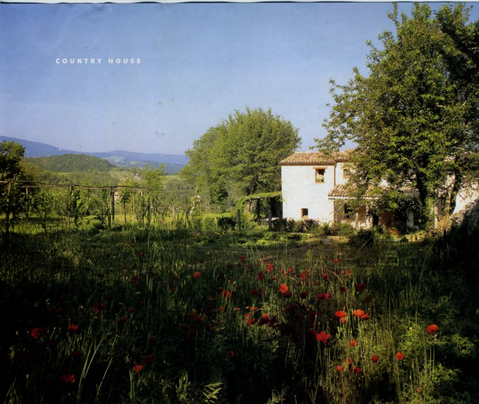
Linksachter de moestuin groeien druivenranken - de eetbare, niet de drinkbare variant! - langs pergola's om het speelveldje van de kinderen.