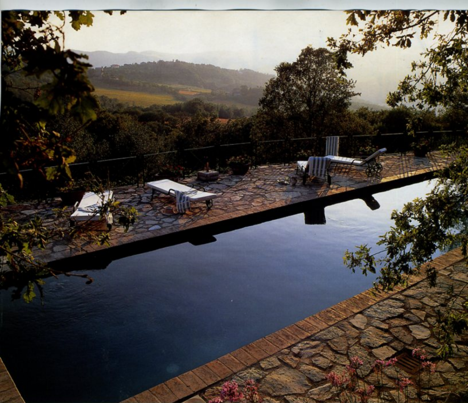
Het zwembad bevindt zich in de oude aia ofwel dorsvloer. Rechtsboven Bij de ouderslaapkamer op de tweede verdieping werd een overdekt terras gecreëerd. Rechts-onder De slechte staat van de fundering maakte het plaatsen van steunberen noodzakelijk, zoals hier aan het eind van de muur langs het terras. Een prijzige verrassing!